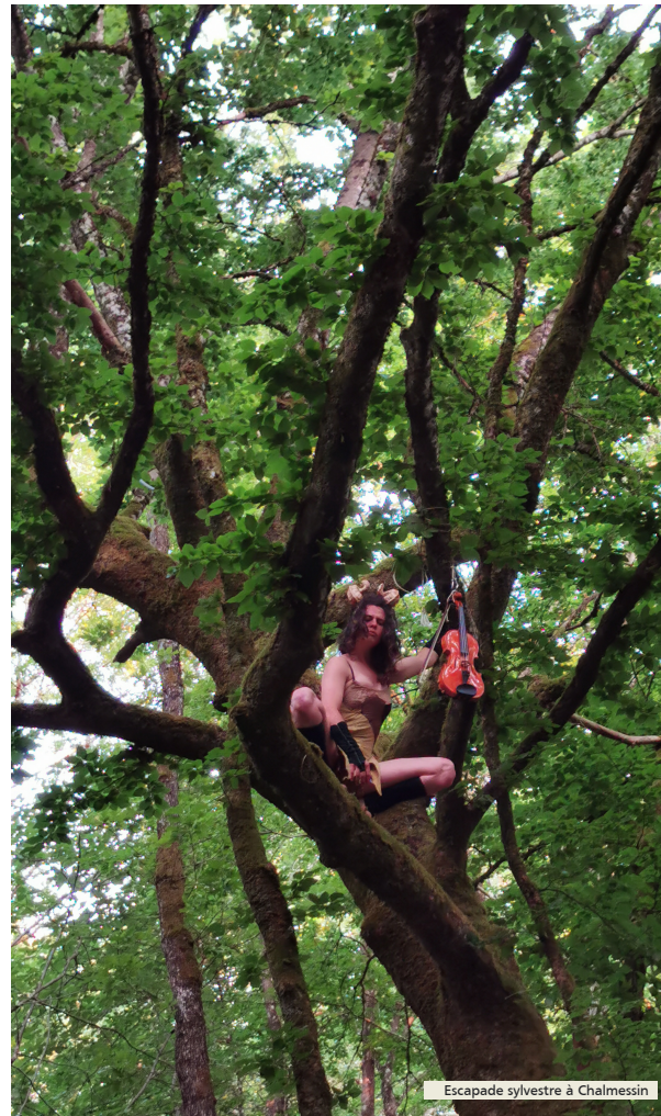
Escapade sylvestre à Chalmessin