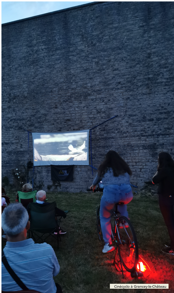
Cinécyclo à Grancey-le-Château