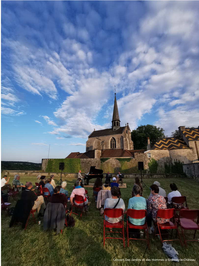
Concert: Des Jardins et des Hommes à Grancey-le-Château

→ Vous souhaitez proposer une œuvre, un spectacle, ou une activité à programmer hors du territoire du Parc national de forêts ? Recensez-vous auprès de l'association Nuits des Forêts via ce formulaire.