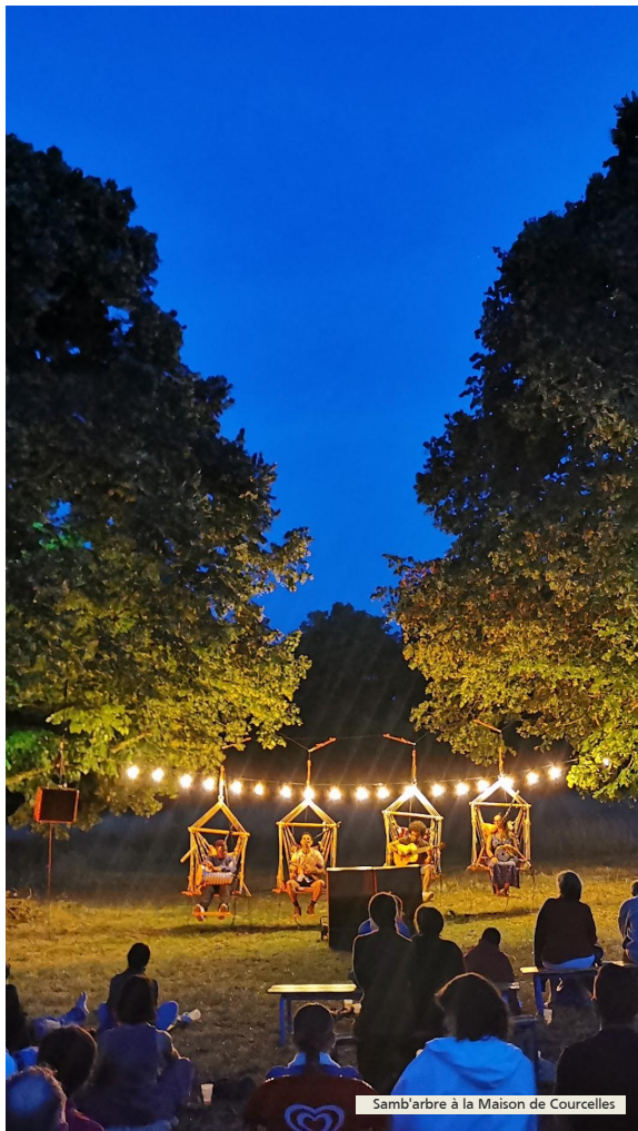
Samb'arbre à la Maison de Courcelles